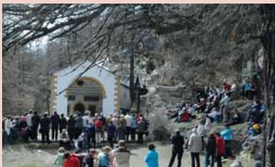
10.30 Messfeier im Altersheim

Alle Pfarreiangehörigen sind zur Teilnahme herzlich eingeladen!