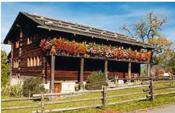
Das Haus von Niklaus von Flüe, in dem er mit seiner grossen Familie lebte

Schon in jugendlichem Alter fastete und betete Niklaus sehr viel; ebenso während seines Ehe- und Familienlebens. Oft stand er nachts, als alle schliefen, auf und betete stundenlang in der Stube. Immer mehr spürte er in sich den Ruf Gottes , der ihn offensichtlich auf einen besonderen Weg führen wollte – weg von seiner Familie und seinem Besitz. Das war aber kein billiges Davonlaufen. Ganz im Gegenteil: Niklaus liebte seine Frau und seine Kinder und war ein vorbildlicher Familienvater. Er machte sich den Entscheid nicht leicht. Über lange Zeit rang er nächtelang um seinen zukünftigen Weg. Wie schmerzlich für ihn dieses Ringen war, zeigt sich, wenn er darüber sagte: «Gott wandte die reinigende Feile an.»