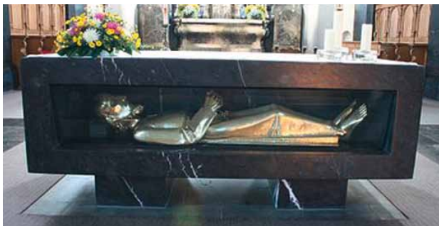
Das Grab des hl. Bruder Klaus im Zelebrationsaltar in der Pfarrkirche von Sachseln

Am 21. März 1487 ist Bruder Klaus nach einem harten Todeskampf im Alter von 70 Jahren auf dem Boden seiner Zelle gestorben und dann in der Pfarrkirche von Sachseln beigesetzt worden, was damals für einen Laien in ländlichen Gegenden absolut aussergewöhnlich war. Heute ruhen seine Gebeine in einer liegenden Bronzestatue hinter einer Glasscheibe im Zelebrationsaltar. 182 Jahre später – 1669 – wurde er vom Papst selig gesprochen und 460 Jahre nach seinem Tod – 1947 – heilig gesprochen .