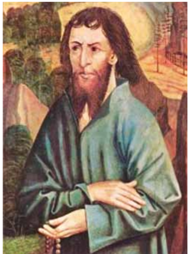
Das älteste Bild von Bruder Klaus, wenige Jahre nach seinem Tod gemalt (1492), heute im Museum Bruder Klaus in Sachseln

In diesem Jahr sind es genau 600 Jahre her, seit Niklaus von Flüe auf die Welt kam. Deshalb wurde 2017 zum Bruder-Klaus-Jubiläumsjahr ausgerufen. Der grosse Friedensstifter und Einsiedler soll uns durch dieses Jahr begleiten. Unter verschiedenen Aspekten wollen wir uns mit seinem Leben und Wirken und mit seiner bleibenden Bedeutung für uns und unser Land befassen. Beginnen wir mit seiner Biografie , um ihn, den grossen Einsiedler, Asketen und Mystiker, noch näher kennenzulernen.